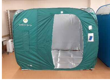
ファミリールーム（ワンタッチパーテーション）20台