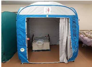
組み立て式トイレ（車いす対応型）1台