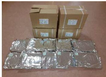
防災用シートイン毛布 50枚